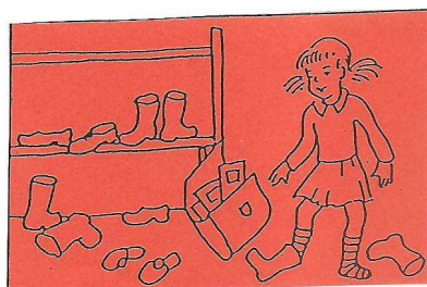
SLIČICE Z DANIMI SITUACIJAMI